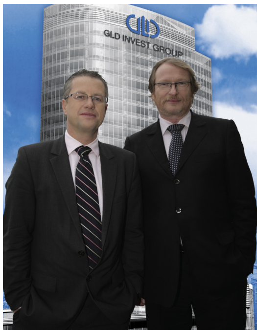
Foto: DI Leopold Sandler, Arch. Gerhard Zehethofer, GLD INVEST GROUP, Abdruck honorarfrei